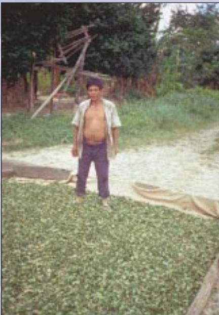
Campeño boliviano con hojas de coca

Los problemas relacionados con las drogas con fines ilícitos forman parte de los desafíos globales a los cuales se ven enfrentados tanto los países desarrollados como los países en desarrollo. Durante mucho tiempo, los países en desarrollo han sido considerados como meros proveedores que fabricaban drogas que luego eran consumidas en las sociedades industriales. Ahora, se vislumbra que estos países también se encuentran afectados por problemas de drogas. Los problemas de desarrollo fomentan en dichos países la producción, el tráfico y el consumo de drogas ilegales. Por otra parte, la problemática de las drogas aumenta la pobreza y agrava los problemas de salud y otros, así mismo, influye negativamente en las condiciones políticas básicas para un desarrollo humano sostenible.