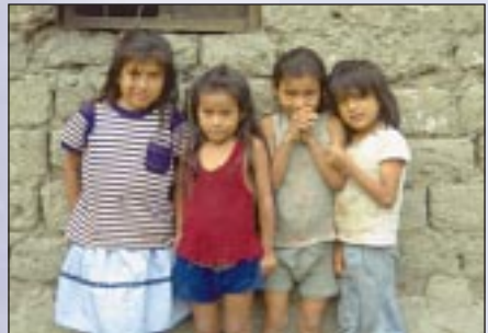
Niños en el Perú: el control de las drogas en el marco de la cooperación al desarrollo ayuda a las personas a encontrar nuevas perspectivas de vida

Un folleto publicado por el BMZ y la GTZ referente al tema ›Drogas y Desarrollo‹ resume la política, las estrategias y experiencias reunidas en el control de las drogas dentro de la cooperación al desarrollo. Fue publicado en abril de 1998 en alemán, inglés y castellano.