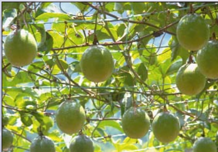
Frutas representan una de muchas alternativas