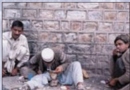
Consumidores de heroína en Pakistán: la mayor parte del opio y de la heroína es consumida en Asia