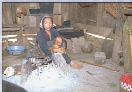
Akba - una minoría en Laos: la pobreza es la causa y consecuencia de problemas relacionados con las drogas