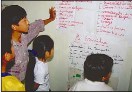
Actividades con adolescentes en el Perú: la prevención como enfoque integral

La GTZ apoya la implementación del concepto ›Drogas y Desarrollo‹ a través de diferentes estrategias. De ellas forman parte: