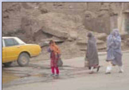
Mujeres en Afganistán: el respeto a los derechos humanos es un requisito indispensable para el éxito del control de las drogas y de programas de desarrollo

El BMZ apoya a nivel mundial medidas que apuntan a las causas sociales y económicas del problema de las drogas. Más allá de esto, el mejoramiento de las condiciones políticas básicas – entre ellas respecto a los derechos humanos, la participación política, la legalidad, eficacia y transparencia del sector público – adquiere una mayor importancia también en relación con el control de las drogas.