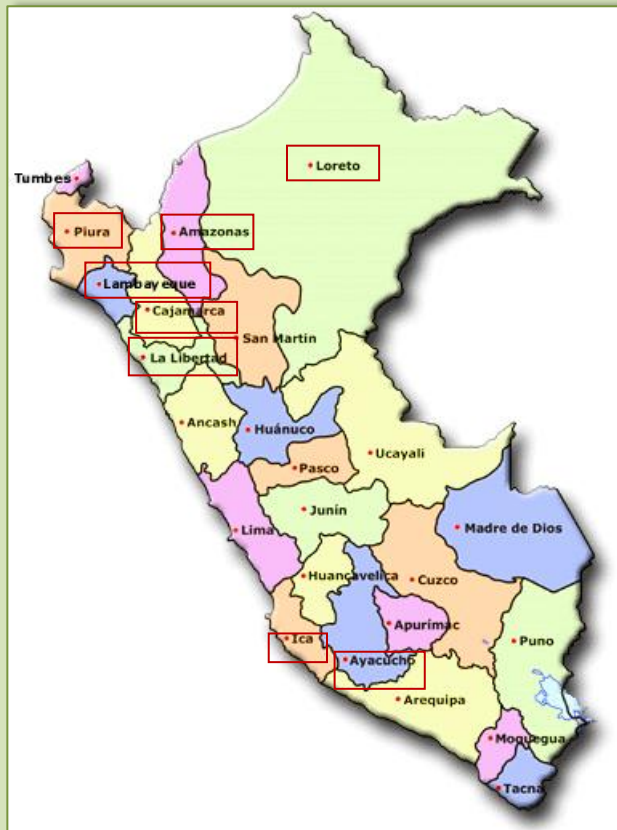
Regionen, in denen die Komponente bezogen auf den Indikator 2 tätig ist.

Stand: Die Regionalregierungen haben die legalen und administrativen Grundlagen für regionale Naturschutzsysteme geschaffen. Die in Cajamarca angewandte Methode zu Konnektivität und Schutzanliegen wurde überregional verbreitet.