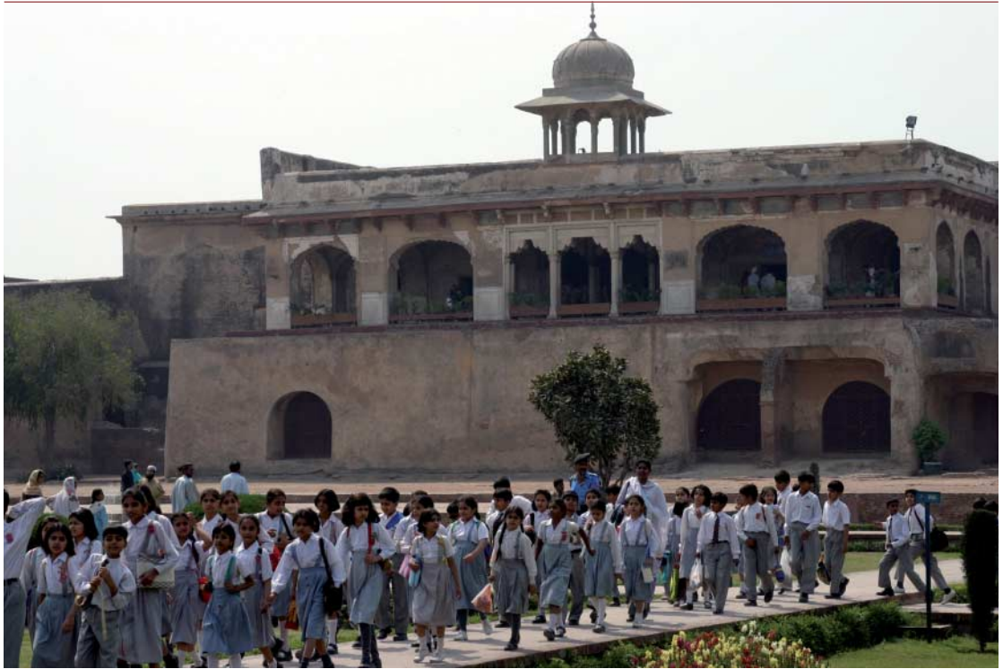
Escuela de niñas realizando una excursión en Lahore, Pakistán