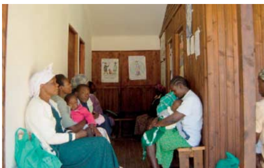
Sala de espera en el Hospital Migori District, Kenya

das. Entre el 60 y el 70 % de estos niños mueren antes de llegar al quinto año de vida. La administración de medicamentos antirretrovirales durante el nacimiento o poco después de él, así como el asesoramiento, apoyo y tratamiento de las madres que viven con el VIH y de sus parejas, que pueden ser proporcionados por programas de PTM, no sólo reducen en un 60 % el riesgo de transmisión del virus de la madre al niño, sino que aumentan la calidad de vida de la familia afectada en general, y de las mujeres en especial. No obstante, en la actualidad sólo alrededor del 11 % de las mujeres que necesitan un programa de PTM pueden contar con él, debido a que muchos países carecen de la ayuda técnica necesaria para su construcción y consolidación. La cooperación técnica alemana desempeña desde 2001 un papel de vanguardia en el apoyo técnico, la construcción, implementación e investigación acompañante continua de programas de prevención de la transmisión materno-infantil en Tanzania, Kenya y Uganda 12 , y apoya a través de sistemas de bonos el acceso autónomo de las mujeres, incluso de aquellas en situación de desventaja económica, a estos servicios 13 .