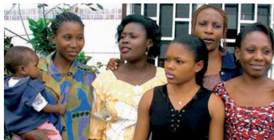
Miembros de la Asociación Tías Mamfé, Camerún

Otro ingrediente fundamental para el fortalecimiento de los derechos de las mujeres en el marco de una respuesta comprensiva al VIH es la prevención de la violencia de género y sexual, sea en el contexto doméstico o como consecuencia de conflictos bélicos, huida y otras situaciones críticas que destruyen las bases de vida y las estructuras sociales. Para prevenir y afrontar la violencia de género, la cooperación alemana para el desarrollo promueve un enfoque multisectorial que incluye el desarrollo urbano, las administraciones locales y los servicios de salud. Un enfoque apoyado en países post-conflicto, como el Congo y Liberia, y también en focos urbanos como los townships sudafricanos, es el de rehabilitación psíquica, médica y económica de las mujeres que experimentaron violencia de género. Además de ofrecerles un tratamiento adecuado, el objetivo de estas medidas es mostrarles posibilidades de protegerse mejor de la violencia de género y de una infección por VIH.