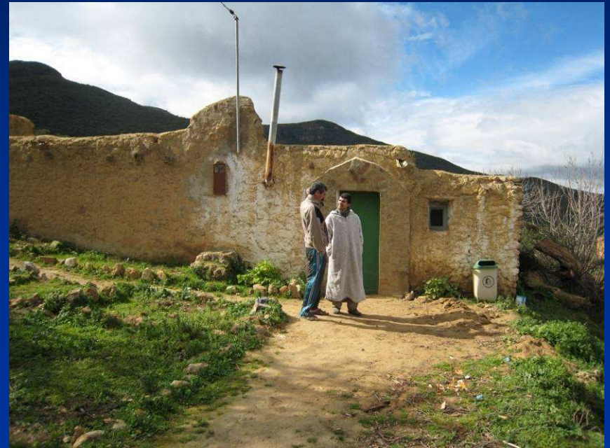
Lokale Herberge in Tafoughalt