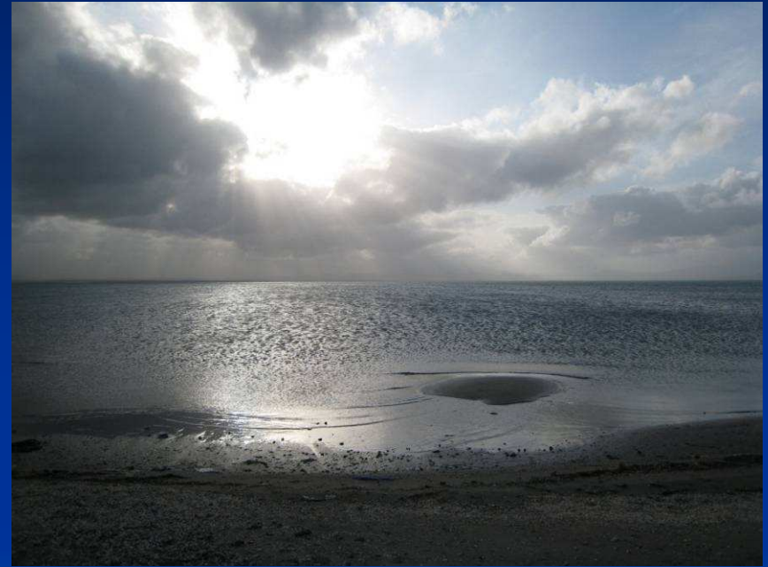
Auf der Landzunge am Haff von Nador, Marchica