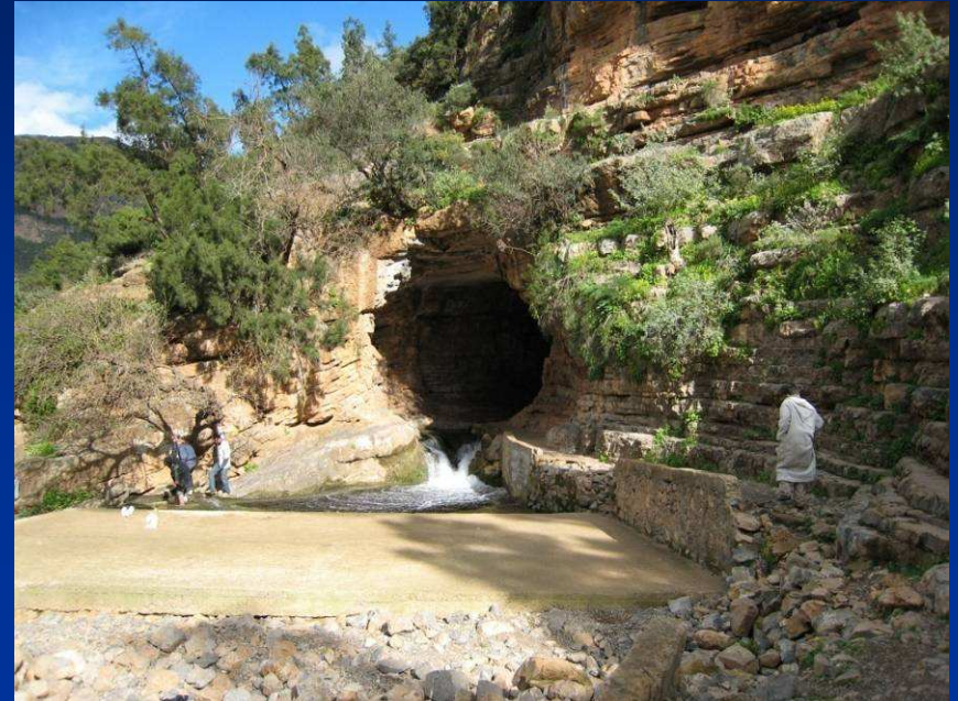
Eingang zur Kamelgrotte (drei Etagen)