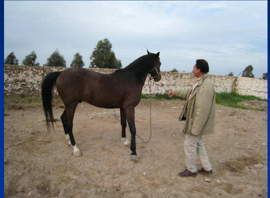
Pferdezucht: Neuanfang für nahezu ausgestorbene Berberassen