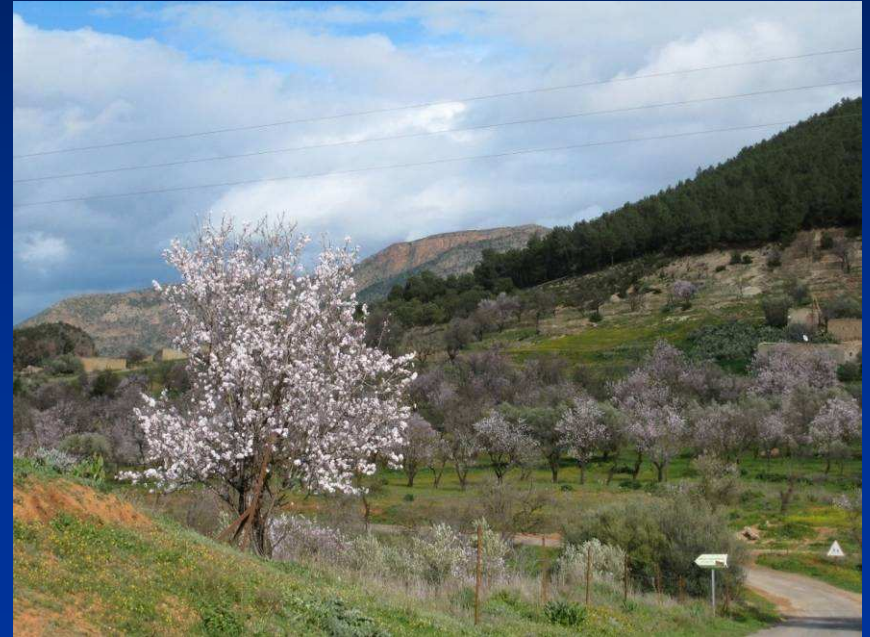
Mandelbaumblüte im Zegzel - Tal