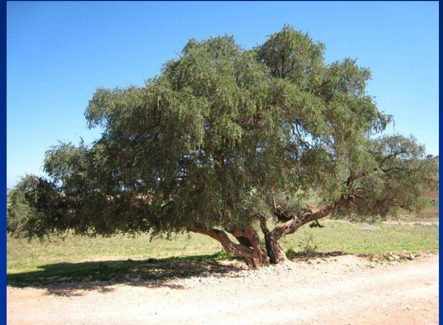
Alter Arganbaum in Chlouhia, Provinz Berkane