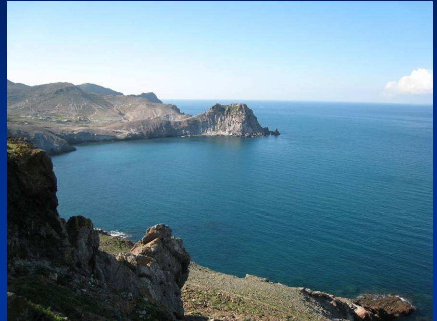
Cap des trois Fourches - Kap der drei Gabeln -