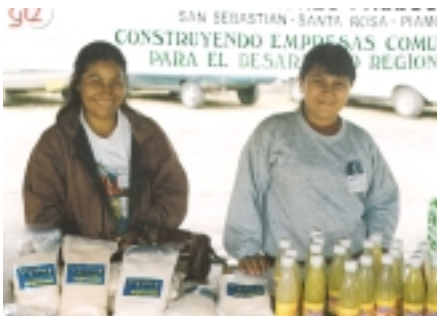
Foto: Proyecto DR Bota Caucana Produktion und Vermarktung von alternativen Produkten in Kolumbien

Die Region Alto Patia ist sehr arm, gleichzeitig sind die staatlichen Institutionen wenig effizient. Die Region ist ein bekanntes Drogenanbaubereich. Das Projekt unterstützt die Gemeinden darin, eine eigenständige umweltverträgliche Wirtschafts- und Sozialentwicklung in der Region zu initiieren, um eine selbsttragende und selbstverwaltete Entwicklung in der Region einzuleiten. Das Projekt leistet einen wichtigen Beitrag, die Probleme mit Armut und Drogenanbau zu mindern und richtet sich v.a. an die armen Bevölkerungsgruppen der Region, in der überwiegend Kleinbauern leben.