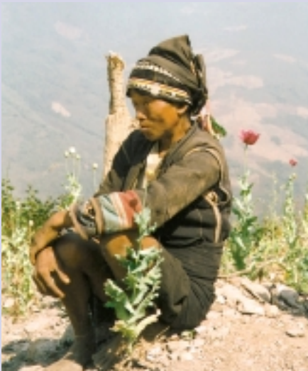
Ein Opiumbauer im Norden von Laos

Das Aktionsprogramm Drogen und Entwicklung (ADE) fördert das Projekt RIAN CB-DAC (Regional Information and Action Networking on Community-based Drug Abuse Control) aus Sondermitteln des BMZ. RIAN unterstützt Gemeinden, die vorhandenen Kenntnisse und Fertigkeiten gemeindegestützter Drogenkontrolle zu systematisieren und zu festigen. Die Gemeinden bilden Netzwerke, tauschen sich untereinander aus, lernen voneinander und bauen ihre erfolgreichen Ansätze dadurch weiter aus. Die Kenntnisse werden in einem Wissens- und Ressourcenzentrum systematisiert. Über Datenbanken stehen Medien wie etwa Videofilme zur Verfügung. Auf dieser Basis können Institutionen, Projekte und Fachleute bewährte Methoden und Konzepte weiterentwickeln und politische Empfehlungen geben. Zu den Zielgruppen des Projekts zählen Gemeinden, in denen Drogenmissbrauch vorkommt und die sich um Drogenkontrolle bemühen, politische Entscheidungsträger und Organisationen mit Beratungsbedarf. Träger des Projektes ist die thailändische staatliche Drogenkontrollbehörde ONCB. Wichtige Nutznießer sind u.a. die mit Drogenkontrolle befassten Projekte der laotisch-deutschen Entwicklungszusammenarbeit. Es ist vorgesehen zum Abschluss der beiden Vorhaben in Thailand (September 2001) die wesentlichen Konzepte und Erfahrungen dieser Projekte zu publizieren.