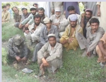
Die letzte Station: Heroinsüchtige in den Straßen Peshawars

Das Projekt, das von der gemeinnützigen, therapeutischen Gemeinschaft DOST Welfare Foundation durchgeführt wird, soll deshalb in den relevanten „settings“, wie z. B. Schulen, Universitäten, in der Nachbarschaft, in Gefängnissen und Parks Jugendliche ansprechen und die Gründung selbsthilfeeorientierter Jugendgruppen als Maßnahme zur Suchtprävention fördern. Die Jugendlichen werden zu sinnvoller Freizeitgestaltung angeregt. Sie werden in Früherkennung und Suchtarbeit geschult und führen mit Gleichaltrigen Präventions- und Interventionsmaßnahmen gegen Drogenmissbrauch durch. Das Projekt richtet sich an männliche und zunehmend auch an weibliche Jugendliche, die suchtgefährdet oder abhängig sind, sowie anderen Bezugspersonen. Es wird eine Verlängerung des Projekts erwogen, um den systemischen Ansatz und die „peer-work“ noch stärker zu professionalisieren.