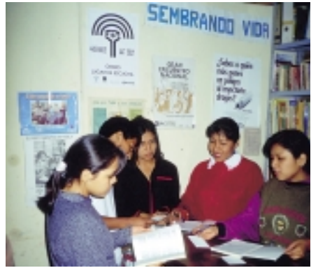
Ausbildung von Jugendlichen in Mazanilla