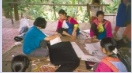
Prävention von Drogenmissbrauch in der Gemeinwesenarbeit

Die thailändische Regierung bemüht sich seit Jahrzehnten um Kooperation mit der internationalen Gemeinschaft, um dem wachsenden Drogenproblem zu begegnen. Die deutsche Regierung unterstützt die Drogenkontrollbehörde ONCB bereits seit 1980. Bis 1998 wurde das Projekt Bergregionen-Entwicklung Nordthailand (Thai-German Highland Development Program, TG-HDP) und ab 1993 das Thailändisch-Deutsche Drogenkontrollprogramm (TG-NCP) gefördert. Dieses Programm soll die Effizienz der Institutionen der Drogenkontrolle erhöhen. Dazu werden die Mitarbeiter der Institutionen und Organisationen in „Human Resource Development“, Training, Prävention und „Law Enforcement“ weitergebildet. Ziel dieses Konzeptes ist vor allem die Stärkung lokaler Behörden in allen Fragen der Drogenkontrolle. Ein großer Verdienst des TG-NCP liegt in seinem Beitrag zur Verankerung dieser Ansätze in der nationalen Entwicklungsplanung und bei deren landesweiten Umsetzung.