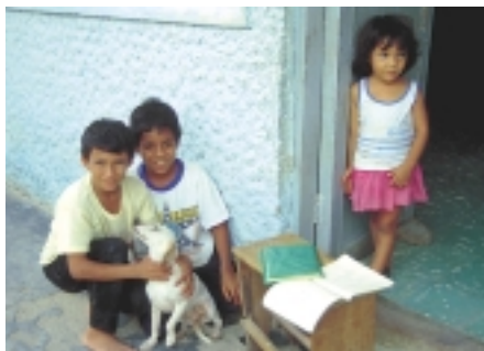
Suchtprävention wird in die Bildungsarbeit integriert

In Manzanilla II, einem Stadtteil Limas mit großen sozialen Problemen, wird die NRO CEDRO dabei unterstützt, ein Präventionsprogramm zu entwickeln und umzusetzen. Dieses Programm richtet sich vor allem an die Kinder und Jugendlichen des Viertels, aber auch an deren Eltern und Bezugspersonen. Es soll deren Lebensperspektiven verbessern und den Drogenmissbrauch reduzieren. Die bisherigen Aktivitäten wurden von den Betroffenen stark unterstützt und schufen ein Bewusstsein für die Drogenproblematik sowie mögliche Lösungsansätze. Durch zusätzliche Ausbildungsmöglichkeiten in technischen Berufen haben sich die Arbeitsperspektiven und Verdienstmöglichkeiten der Jugendlichen verbessert. Nach vierjähriger Laufzeit soll dieser Ansatz ab Ende 2001 auch auf andere Stadtteile übertragen werden.