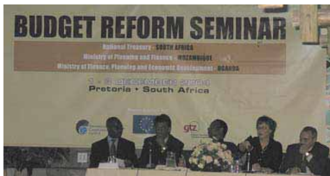
Seminar im Dezember 2004 in Pretoria

Ziel der Initiative ist es, lokales Fachwissen aufzubauen und die Geberdominanz bei der Gestaltung von Reformprozessen abzubauen. Die Haushaltsdirektoren der Region nutzen CABRI als Netzwerk zum Erfahrungsaustausch. Nachdem die Teilnehmer in einem ersten inhaltlichen Seminar im Dezember 2004 in Pretoria ihren Bedarf und ihre Unterstützung für ein derartiges Netzwerk ausgesprochen haben, fand im Juni 2005 die formelle Gründungsveranstaltung von CABRI als panafrikanisches Netzwerk in Nairobi statt.