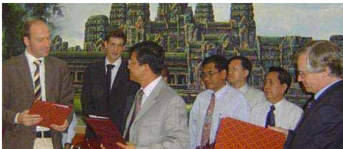
Minutes of Meeting, Kambodscha