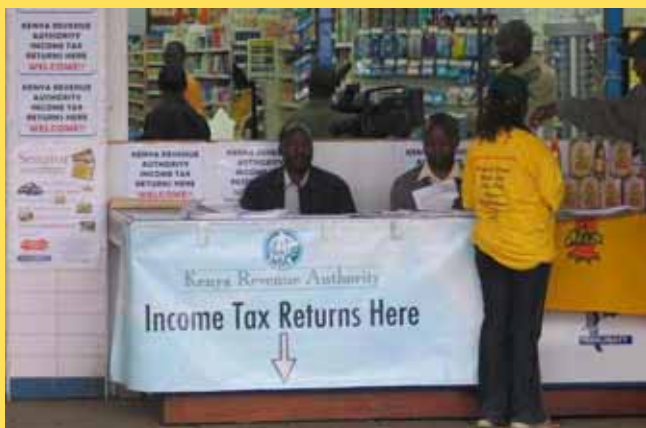
Mobile Steuerverwaltung Kenia

Dieser Aussage haben sich auch die G8-Staaten Anfang Juli verschrieben, als sie den ärmsten Entwicklungsländern Afrikas in ihrem Communiqué von Gleneagles eine Steigerung der offiziellen Entwicklungshilfe (ODA) um 50 Mrd. US-Dollar zugesagt haben. Damit wurde die weltweite Aufmerksamkeit in diesem Jahr – nach dem Sachs-Report und dem Report der Commission for Africa (CfA) – zum wiederholten Male auf die Belange Afrikas gelenkt und an die Verantwortung des Westens appelliert, die Entwicklungsländer finanziell zu unterstützen. Durch die medienwirksamen Live8-Auftritte im Vorfeld des G8-Gipfels hätte man – oberflächlich betrachtet – beinahe den Eindruck gewinnen können, eine neue Ära der Nord-Süd Partnerschaft sei angebrochen. Die Aussage Entwicklung braucht Finanzierung geht also offenbar nicht nur auf empirische Beobachtung zurück, sondern steht in der öffentlichen Wahrnehmung auch für die moralische Verpflichtung des Westens, die Entwicklungsstrategien in den unterentwickelten Teilen dieser Welt zu finanzieren.