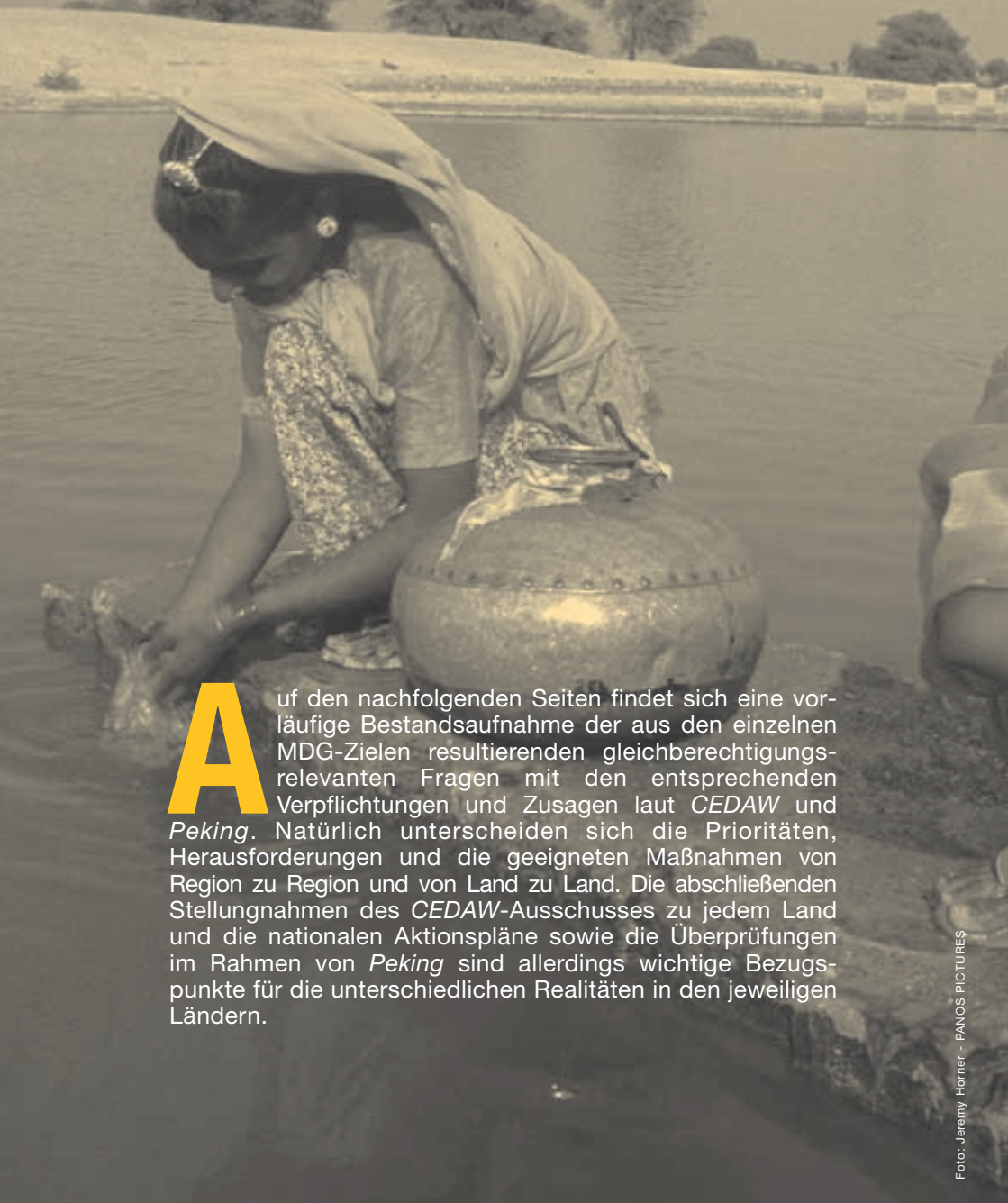
Frauen beim Wasserholen in einer Oase in der Nähe von Jodhpur (Indien)

A uf den nachfolgenden Seiten findet sich eine vorläufige Bestandsaufnahme der aus den einzelnen MDG-Zielen resultierenden gleichberechtigungsrelevanten Fragen mit den entsprechenden Verpflichtungen und Zusagen laut CEDAW und Peking . Natürlich unterscheiden sich die Prioritäten, Herausforderungen und die geeigneten Maßnahmen von Region zu Region und von Land zu Land. Die abschließenden Stellungnahmen des CEDAW -Ausschusses zu jedem Land und die nationalen Aktionspläne sowie die Überprüfungen im Rahmen von Peking sind allerdings wichtige Bezugspunkte für die unterschiedlichen Realitäten in den jeweiligen Ländern.