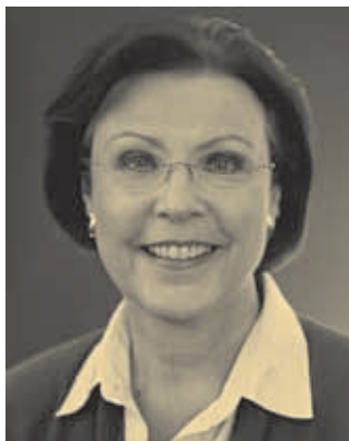
Heidemarie Wieczorek-Zeul Bundesministerin für wirtschaftliche Zusammenarbeit und Entwicklung

An ihrer Aktualität haben das Übereinkommen zur Beseitigung aller Formen der Diskriminierung von Frauen (CEDAW), die Erklärung der vierten Weltfrauenkonferenz in Peking und die darauf gründende Aktionsplattform von Peking nichts verloren. Sie sind Ausgangspunkte für die Erschließung des Potenzials zur Gleichberechtigung, die in den MDGs vorhanden sind.