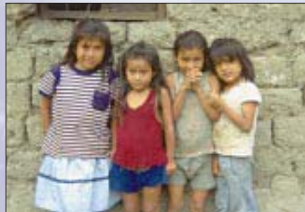
Kinder in Peru: Die Drogenkontrolle im Rahmen der Entwicklungszusammenarbeit hilft Menschen, neue Lebensperspektiven zu finden.

Eine vom BMZ und der GTZ herausgegebene Broschüre zum Thema ›Drogen und Entwicklung‹ faßt Politik, Strategien und Erfahrungen der Drogenkontrolle in der Entwicklungszusammenarbeit zusammen. Sie ist im April 1998 in deutscher, englischer und spanischer Sprache erschienen.