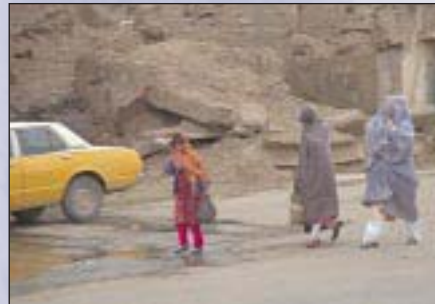
Frauen in Afghanistan: Die Beachtung der Menschenrechte ist eine notwendige Voraussetzung für den Erfolg von Drogenkontrolle und Entwicklungsprogrammen

Das BMZ unterstützt weltweit Maßnahmen, die auf die sozialen und wirtschaftlichen Ursachen der Drogenproblematik zielen. Darüberhinaus gewinnt die Verbesserung der Rahmenbedingungen – darunter die Beachtung der Menschenrechte, politische Partizipation, Rechtsstaatlichkeit, Effizienz und Transparenz des öffentlichen Sektors – auch im Zusammenhang mit der Drogenkontrolle an Bedeutung.