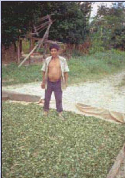
Bolivianischer Bauer mit Kokablättern

Lange Zeit galten Entwicklungsländer lediglich als Zulieferer, die die Drogen herstellten, die in Industriegesellschaften verbraucht wurden. Inzwischen zeigt sich aber, daß Entwicklungsländer selbst ebenfalls von der Drogenproblematik betroffen sind. Entwicklungsprobleme fördern dort Produktion, Handel und Konsum illegaler Drogen. Drogenprobleme verstärken wiederum Armut, Gesundheits- und andere Entwicklungsprobleme und beeinträchtigen die Rahmenbedingungen für nachhaltige menschliche Entwicklung.