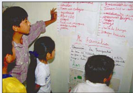
Arbeit mit Jugendlichen in Peru: Prävention ganzheitlich denken

Die GTZ unterstützt die Umsetzung des Konzepts ›Drogen und Entwicklung‹ mit Hilfe folgender Strategien: