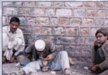
Heroinkonsumenten in Pakistan: Der größte Teil des Opiums und Heroins wird in Asien verbraucht.