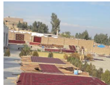
Teppichproduktion | Foto: Karl Mahringer

Im Auftrag des Auswärtigen Amtes vermittelt CIM Fach- und Führungskräfte an afghanische Fachministerien, um deren Verwaltungs- und Managementkapazitäten zu stärken. Ein Beispiel: Im afghanischen Außenministerium ist eine Integrierte Fachkraft angestellt. Als Abteilungsleiter und Direktor der politischen Abteilung koordiniert die CIM-Fachkraft die afghanischen Vertretungen in den Staaten Westeuropas sowie deren Vertretungen in Afghanistan. Sie ist für die Berichterstattung gegenüber dem Außenminister verantwortlich, veranlasst politische Analysen, die die gesellschaftlichen Entwicklungen in den Staaten Westeuropas betreffen und wertet internationale Presseberichte aus. Darüber hinaus gestaltet sie die Kontakte zu internationalen Organisationen der bi- und multilateralen Zusammenarbeit. Weitere