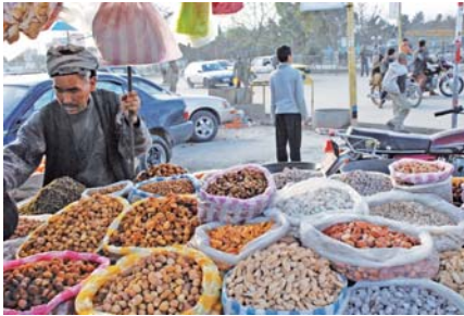
Trockenfrüchte auf Basar

förderagentur, der Promotion Agency Afghanistan (EPAA). Ihre Aufgabe ist die Förderung des Exports von afghanischen Produkten – darunter Frischobst und