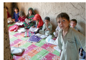
Schulunterricht in Kobi Safi