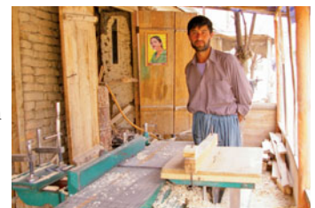
... und steigert die Produktivität im Kleingewerbe

Für internationale Geber ist die GTZ ebenfalls tätig: In der südlichen Provinz Uruzgan führt die GTZ im Auftrag der niederländischen Regierung ein Provinz-Entwicklungsprogramm zur Förderung der ländlichen Wirtschaft, der Qualifizierung von Verwaltungspersonal und zum Bau einer wichtigen Verbindungsstraße durch. Für den Globalen Fonds zur Bekämpfung von HIV/AIDS, Tuberkulose und Malaria unterstützt die GTZ ein HIV-Programm. Auch die Weltbank setzt auf die GTZ, unter anderem bei der Förderung der Schulbildung von Mädchen.