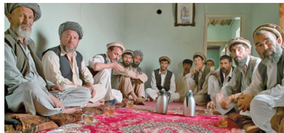
Zusammenkunft eines Ältestenrates (Shura)

Instrumente verzahnen: Über Distrikt- oder Provinzentwicklungsfonds im Rahmen der ENÜH können Gemeinden Anträge auf Projekte stellen, die sie mit Unterstützung der GTZ in eigener Verantwortung durchführen, sei es der Bau einer Brücke, Straße, von Brunnen oder einer Schule. Solche stabilisierenden Maßnahmen gehen in langfristige Vorhaben über – eine Hilfe, die sich am Ende selbst trägt.