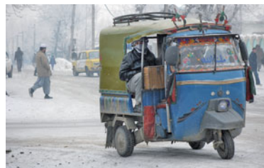
Straßenszenen in Kunduz