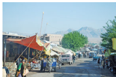
... und in Tarin Kowt