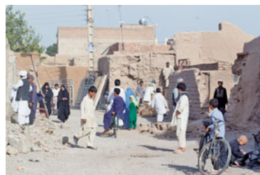
... in Herat