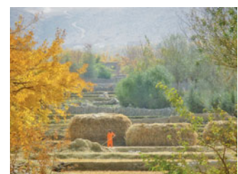
Landwirtschaft in Khenjan