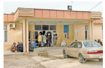
Das Balkh-Krankenhaus ist das Zentrum der Gesundheitsversorgung in der Region

Die GTZ arbeitet auch im Auftrag anderer Bundesressorts. Für das Auswärtige Amt unterstützt die GTZ zum Beispiel den Bau und die Ausstattung von Polizeieinrichtungen und Ausbildungszentren. Außerdem bildet die GTZ das Leitungspersonal von Krankenhäusern weiter. Im Auftrag des Bundesverteidigungsministeriums steuert die GTZ den Bau von Einsatzliegenschaften der Bundeswehr in Kunduz und Taloqan.