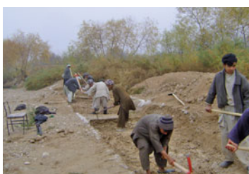
Bau von Flutschutzmauern