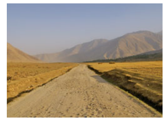
Bewirtschaftung unter erschwerten Bedingungen

Risiken minimieren: Die GTZ verfügt im Verbund mit den anderen deutschen Durchführungsorganisationen über ein umfassendes Risikomanagementsystem. Dieses spannt sich wie ein Schirm über alle Vorhaben, um die Handlungsspielräume und die Mobilität der Mitarbeiterinnen und Mitarbeiter abzusichern. Auch beim Thema Sicherheit spielt kultursensibles Verhalten eine entscheidende Rolle, denn die Kompetenz und Glaubwürdigkeit der Mitarbeiterinnen und Mitarbeiter helfen Risiken zu verringern und Sicherheitszusagen für die Umsetzung von Entwicklungsvorhaben zu erhalten.