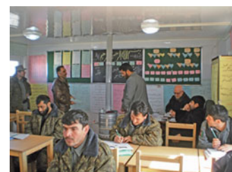
Alphabetisierung von Polizisten