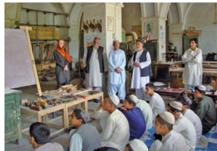
Berufliche Bildung