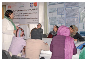
Schulung von Rechtsanwältinnen