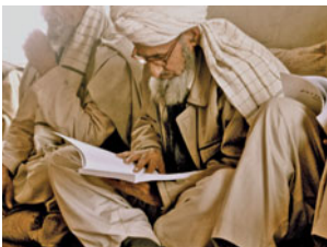
Stammesführer werden in Gesetzestexten geschult

Seit über 30 Jahren prägen kriegerische Konflikte und ethnische Spannungen die Situation in Afghanistan. Die Lebensgrundlagen der Bevölkerung sind weitgehend zerstört. Als eines der ärmsten Länder der Welt ist Afghanistan Schwerpunktland der deutschen sowie internationalen Entwicklungszusammenarbeit. Die Staatengemeinschaft unterstützt den zivilen Wiederaufbau seit dem Sturz des Taliban-Regimes im Jahr 2001. Deutschland übernimmt in den Nordprovinzen Kunduz, Takhar, Badakhshan, Baghlan und Balkh eine besondere Verantwortung, denn dort ist die Bundeswehr im Rahmen des Einsatzes der Internationalen Schutztruppe Afghanistans (ISAF) auch militärisch engagiert.