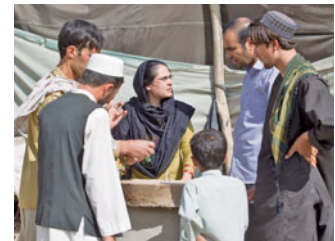
Planungsgespräche für eine Biogasanlage