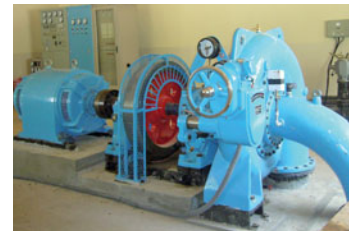
Strom wird aus Wasserkraft gewonnen / Provinz Badakhshan

Für internationale Geber ist die GTZ ebenfalls tätig: In der südlichen Provinz Uruzgan führt die GTZ im Auftrag der niederländischen Regierung ein Provinz-Entwicklungsprogramm zur Förderung der ländlichen Wirtschaft, der Qualifizierung von Verwaltungspersonal und zum Bau einer wichtigen Verbindungsstraße durch. Für den Globalen Fonds zur Bekämpfung von HIV/AIDS, Tuberkulose und Malaria unterstützt die GTZ ein HIV-Programm. Auch die Weltbank setzt auf die GTZ, unter anderem bei der Förderung der Schulbildung von Mädchen.